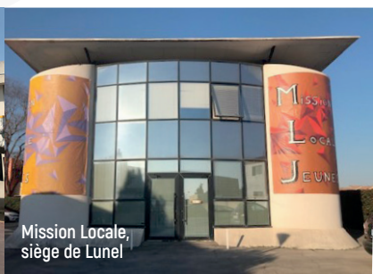
Mission Locale, siège de Lunel

Vous pouvez appeler pour prendre rendez-vous avec un conseiller à Lunel, Mauguio ou sur les lieux de permanences (voir page 2) ou vous présenter directement aux horaires d'ouverture, un conseiller sera disponible pour vous recevoir !