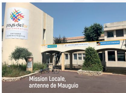
Mission Locale, antenne de Mauguio

L'inscription est gratuite et peut se faire tous les jours en fonction de votre lieu de résidence.