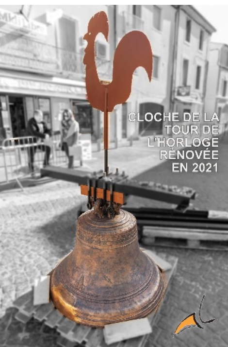
CLOCHE DE LA TOUR DE L'HORLOGE RÉNOVÉE EN 2021

connaîtra ensuite de nombreux propriétaires. La Tour de l'horloge est un des plus anciens bâtiments du village. Sa cloche a été rénovée en 2021.